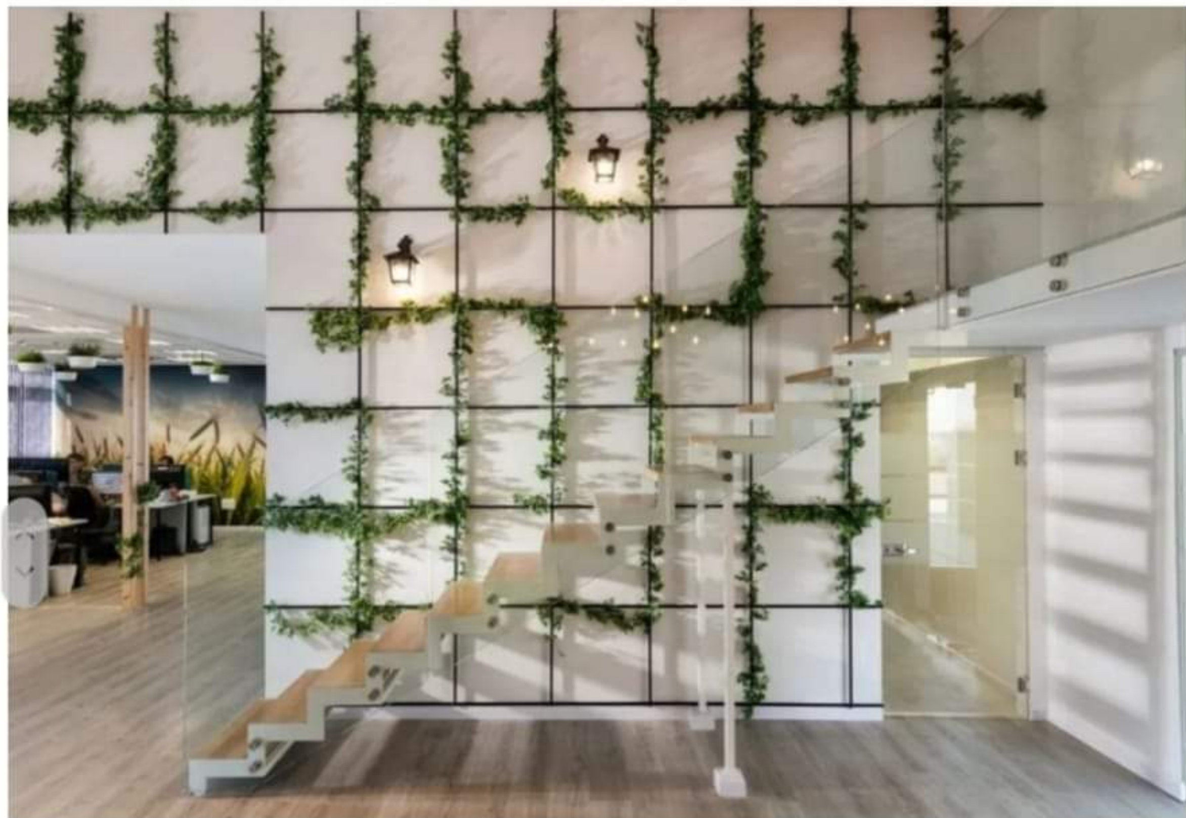
משרדי טראניס

האפשרות לקום מכיסא המחשב אל המרחב הירוק, נולדה כפתרון יצירתי לצורך של העובדים לחלץ את הגוף ולחשוב מחוץ לקופסה. "גם בחלל המשרדים המשותף, בחדרי המנהלים ובמסדרונות הכנסנו נגיעות של צמחייה ירוקה. הם שולבו כצמחייה מטפסת או כיצירה דקורטיבית על קירות החלל". האתגר בתכנון והעיצוב היה בבניית הקונספט. "רצינו שהמשרדים לא יהיו רק מעוצבים, אלא שהסיפור של החברה ישתלב בכל פינה וישדר לכל לקוח פוטנציאלי שהגיע למקום הנכון, ובמקביל ליצור לעובדים סביבת עבודה שתסייע להם להפיק את המרב מעצמם — להוציא אנרגיות ולהתמלא באנרגיות חיוביות", היא אומרת.