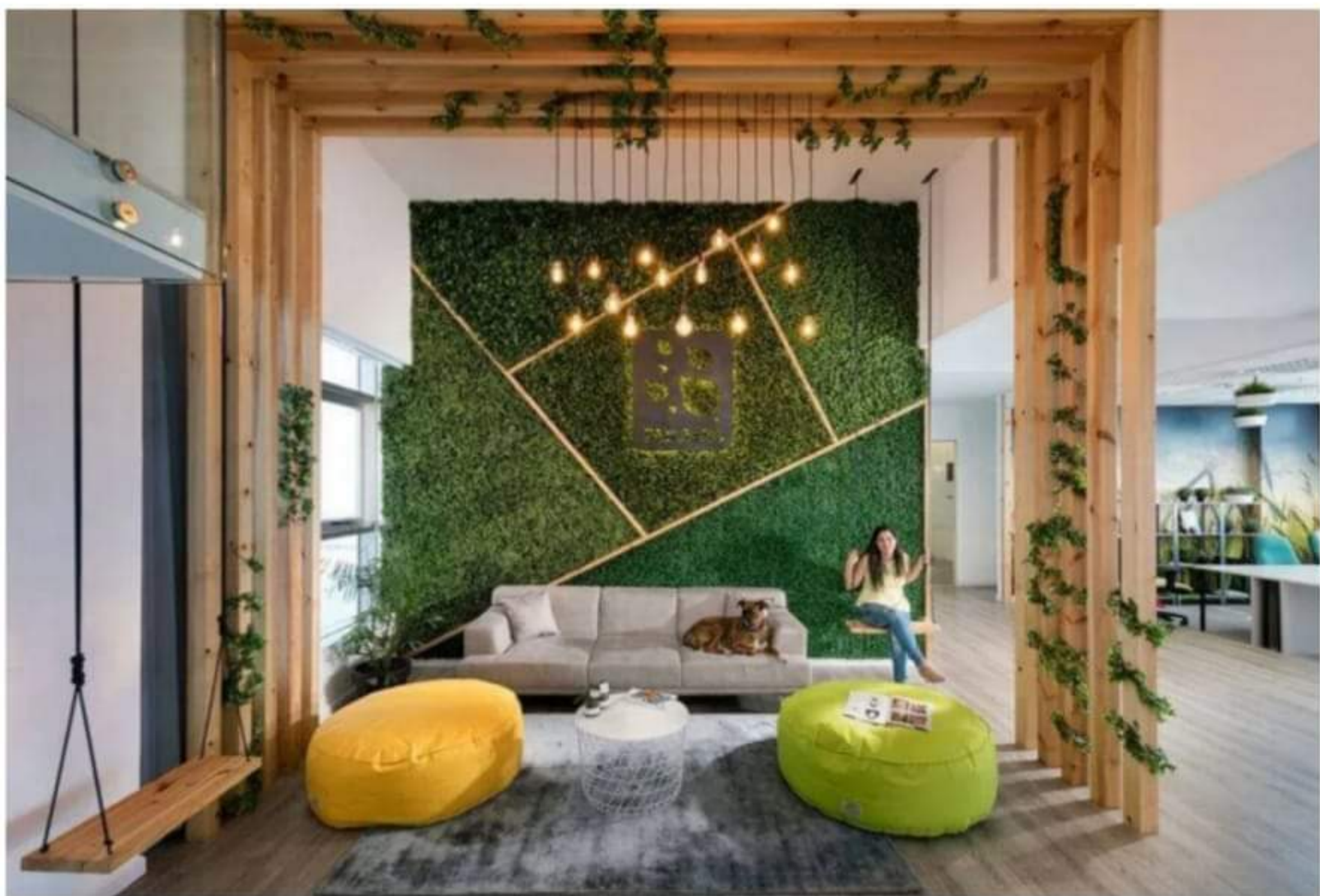
משרדי טראניס